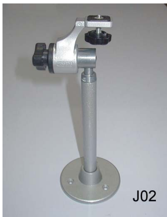
图 6 照相机用的一种万向支架

被中香炉，两千多年以前中国的发明，在今天被派上了许多用场。随着机器人和自动控制等科学和技术领域的研究和发展，将来还会有更多的用场。不过想到这段漫长的岁月中，我们虽然发明得很早，从汉代，一直到清代，却一直是用在熏被窝上。西方人虽然直到 16 世纪才发明，比我们落后了 1600 年。但后来的许多使用的新花样却是他们首先开发出来的。这也许很值得我们向西方学习，重振我们民族的创造力。