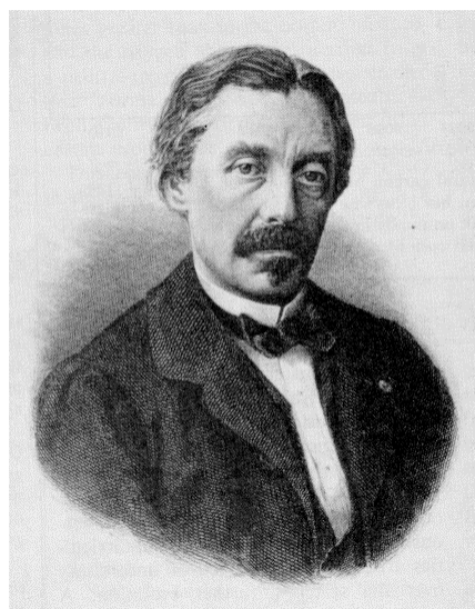
图 3 佛科像

真正把万向支架用在现代科学研究上，并且做出重要发现的是法国人佛科（Jean-Bertrand-Léon Foucault, 1819-1868）。他在 1851 年提出利用高速旋转的陀螺来显示地球的自转。高速旋转的陀螺有保持旋转轴不变的性质。如果把陀螺放置在万向支架上，支座在地球上，地球旋转而陀螺的轴不旋转。经过不多的时间，陀螺相对于支架的变动就明显地说明地球的自转。佛科利用他前一年发明的佛科摆和这种陀螺仪雄辩地证明了地球的自转。所以佛科又称它为“转动指示器”。从此万向支架又有一个新的名字：陀螺支架。