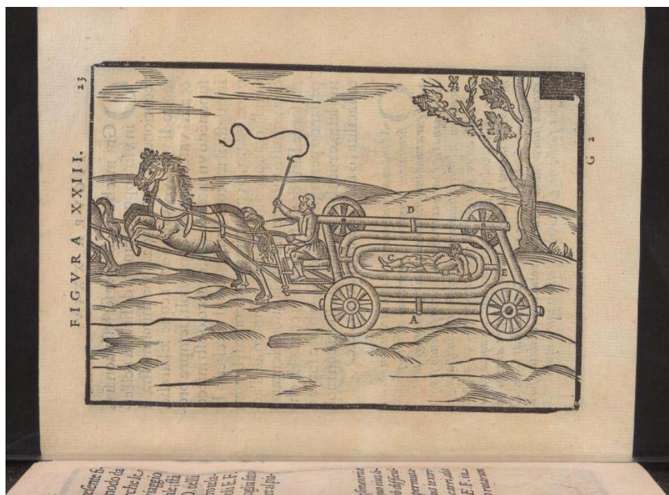
图2 利用万向支架减震的设想

把一个物体固定在基座上，无论基座怎样旋转，要求物体的方向不会变动。这就是被中香炉最本质的功能。这种机构随着科学技术的发展有很多重要的应用。这种支架称为万向支架，也称常平支架。