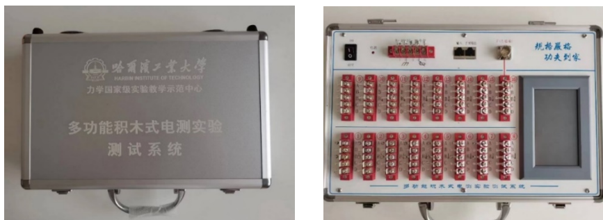
附图三 静态电阻应变仪